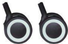
앞바퀴 x 2