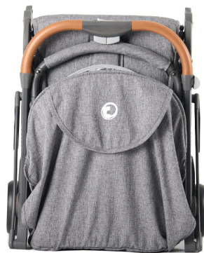
본체 x 1